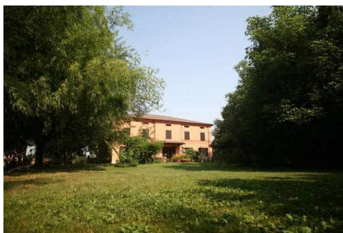
Agriturismo I Gelsi – via Canalazzo 129 - Ganaceto (Modena)